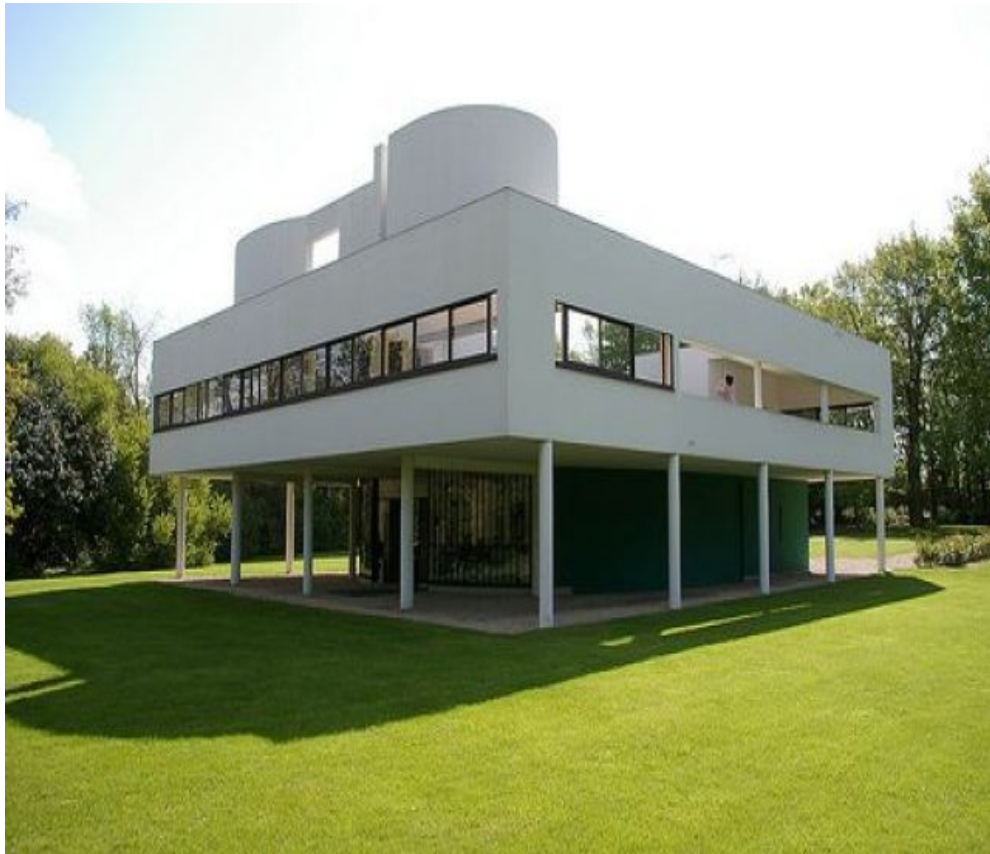
MAISON LE COBUSIER.